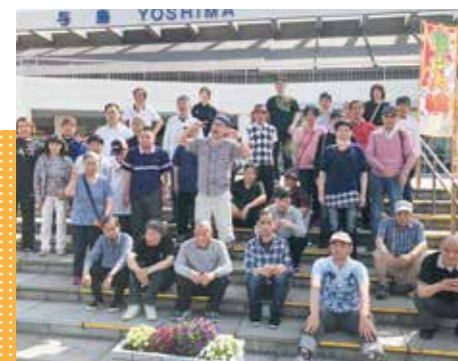
日帰りレクリエーション