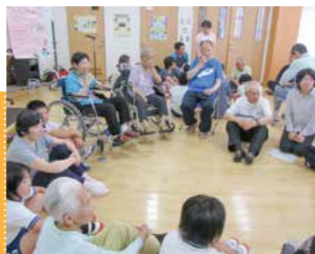
地元の子供との交流会