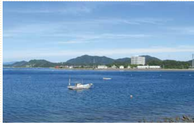
2階から見た風景(瀬戸内海国立公園 ウチノ海)