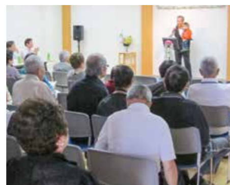
地域カラオケ交流会