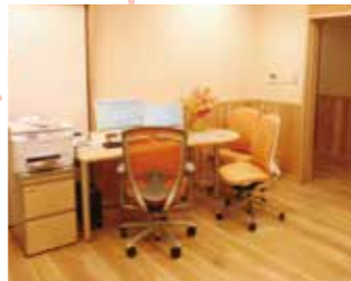
いやしの杜クリニック