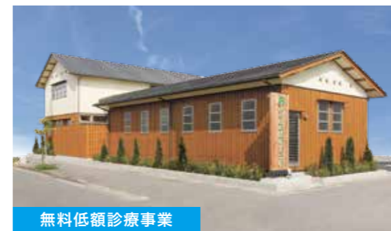
無料低額診療事業

所在地 徳島県鳴門市瀬戸町明神字上本城85番地 電話 088-688-0180(代) 定員 60名