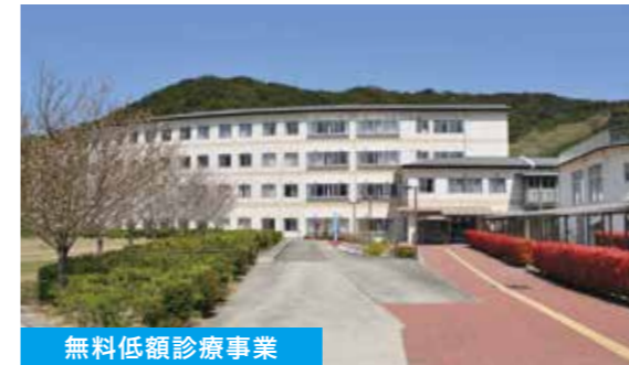
無料低額診療事業