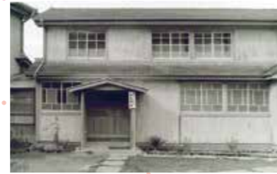
併設された小鳴門荘