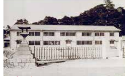
かつての阿波井島保養院