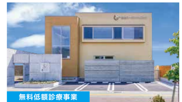
無料低額診療事業

所在地 徳島県鳴門市撫養町小桑島字前浜199番地 電話 088-676-2600(代) 診療科目 心療内科 精神科 神経内科 診療日 月・火・木・金・土（水・日・祝日…休診） 診療時間 9:00～12:00 13:00～17:00