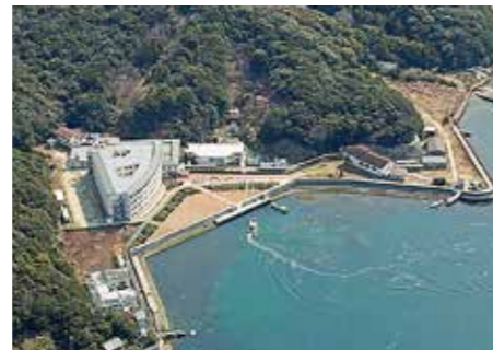
空から撮影した鳴門シーガル病院