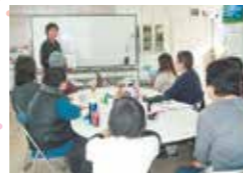
デイケア(アロマテラピー教室)